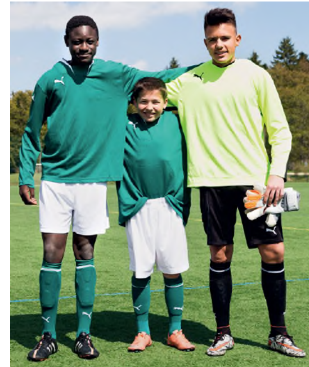
Die drei Spieler auf diesem Foto sind gleich alt, zeigen aber im Moment unterschiedliche körperliche Fähigkeiten.